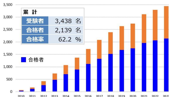
CPF 受験者および合格者 2010～2023年度 累計